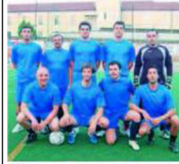
Le Risate in Scatola e, nella foto piccola a destra, i Tana Tana, due tra le formazioni protagoniste del torneo "Sportiva Salesiana"

CHIERI Rimasti e Le Api Operate continuano a dettare legge anche dopo la seconda settimana di gare del "Torneo Sportiva Salesiana", competizione di calcio a 7 che anima le serate sul campo in sintetico dell'oratorio San Luigi. Nel girone A i Rimasti hanno confermato il loro primato, restando l'unica formazione a punteggio pieno. La vittoria nello scontro diretto ottenuta contro le Risate in Scatola ha permesso alla capofila di portarsi da sola